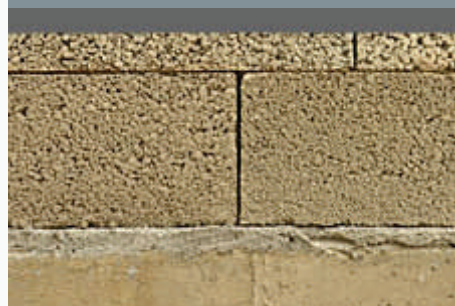
Die Ausgleichsschicht muss ausreichend erhärten, bevor die Wand weiter gemauert werden kann.