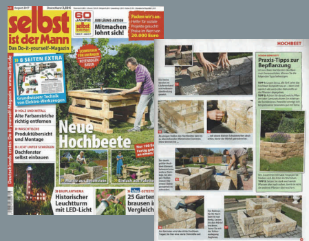
Das JASTO Blumenbeetset in der August-Ausgabe der Zeitschrift „selbst ist der Mann“.

Die Zeitschrift „selbst ist der Mann“ zeigt in der August-Ausgabe ausführlich, wie man ein Hochbeet im eigenen Garten anlegt. Mit dabei: Das JASTO Blumenbeetset Typ B in der Farbvariante „sahara“. In einer kompletten Bilderreihe vom Setzen des Fundaments über den Aufbau bis zur Bepflanzung zeigt das Do-it-yourself-Magazin alle Arbeitsschritte im Detail. Unsere rustikalen Betonsteine machen dabei eine gute Figur.