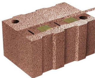
Abb. 36,5er JASTOPLAN Ultra Therm

Die neuen JASTOPLAN Ultra Thermsteine vereinen somit Wärme- und Schallschutz sowie statische Anforderungen auf einem ganz neuen Level. Zur besonderen Kennzeichnung werden sie in roter Ausführung hergestellt.