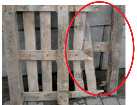
Beispiele unbrauchbarer Paletten

Bei unbrauchbaren Paletten kann keine Gutschrift erfolgen!