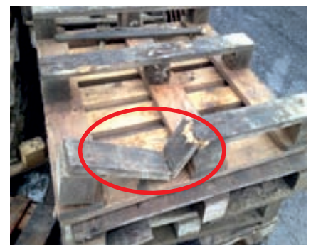
Beispiele reparaturfähiger Paletten

Diese werden durch uns oder von einem durch uns beauftragten Unternehmen instandgesetzt und gemäß Vereinbarung mit einem verminderten Betrag gutgeschrieben.