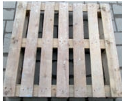
Beispiele unbeschädigter Paletten

Der Pfandbetrag wird hier bei Rückgabe im Werk, Strecke oder Lager zu den jeweils vereinbarten Konditionen gutgeschrieben.