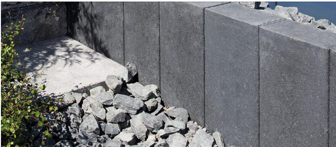
JASTO Trendline-Palisade in anthrazit

Einige Neuerungen finden Sie bei unserem Trendline-Programm. So sind z. B. Trendline-Pflaster und Trendline-Platte nun in scharfkantiger Ausführung erhältlich, weiterhin gibt es für das Trendline-Pflaster jetzt eine Aqua-Variante mit 8 mm Fugenbreite. Mit der neuen Trendline-Palisade wird die Familie komplettiert. Als Hohlpalisade lässt sie sich deutlich einfacher versetzen als handelsübliche Palisaden und sie ist zudem noch weniger Bruchanfällig.