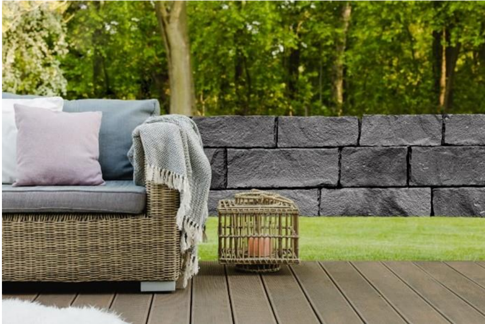
Betobloc® von JASTO im Farbton anthrazit

Steine ein außergewöhnliches Fugenbild wie es sonst nur bei Natursteinmauern entsteht.