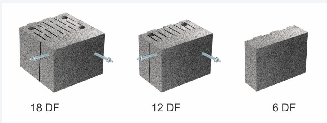
JASTO System-Laibungssteine in den Formaten 18 DF, 12 DF und 6 DF mit einer Wanddicke von 36,5 cm.

Zum System wird das Laibungspaket durch seine unterschiedlichen Steinformate und die Einbindung in die Jasto-Produktpalette. Die Laibungssteine werden als 18 DF, 12 DF und 6 DF Stein jeweils mit einer Wanddicke von 36,5 cm produziert und lassen sich mit allen JASTO Therm Steinen gleicher Wanddicke kombinieren. Die verschiedenen Formate stellen die Einhaltung des Überbindemaßes sicher. Die Steine erreichen die Steinfestigkeitsklasse 4 sowie eine charakteristische Druckfestigkeit von 2,7 N/mm 2 und eine Wärmeleitfähigkeit von 0,11 W/mK. Lieferbar ist das System-Laibungspaket sowohl in einer normalen als auch in einer rot eingefärbten Ultra Therm-Variante. Auf „jasto.de“ finden Sie hier weitere Infos zum JASTO System-Laibungspaket.