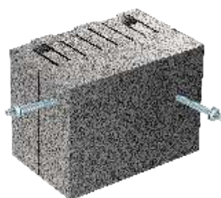
12 DF (24,7 x 36,5 x 24,9 cm) (4 Steine pro Lage)