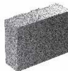
6 DF (12,4 x 36,5 x 24,9 cm) (1 Stein pro Lage)