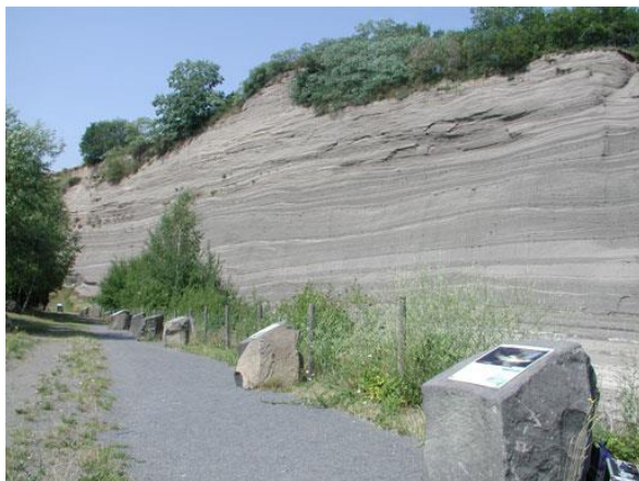
Ablagerung des Bimsgesteins in Schichten mit Dicken bis zu 7 m