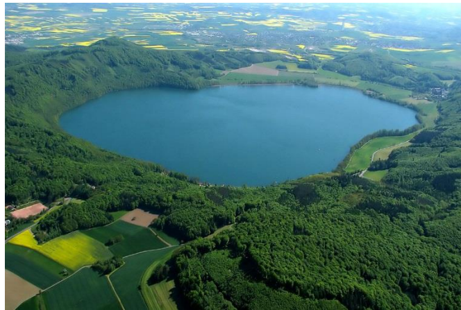
Der Laacher See in der Vulkaneifel

Das Thema Nachhaltigkeit wird durch die abnehmenden Ressourcen in den Bereichen Rohstoffe und Energiegewinnung immer bedeutender. Das schlägt sich auch in steigenden gesetzlichen Anforderungen im Bausektor nieder, das GebäudeEnergieGesetz (GEG) gilt seit 01. November 2020 und wurde 2023 novelliert. Dieses Thema wird dadurch auch immer mehr in das Bewusstsein der Bürgerinnen und Bürger und damit unserer Kunden gerückt. Auch die Leichtbetonindustrie ist sich dieser Tatsache bewusst und hat die umwelttechnischen Eigenschaften ihrer Baustoffe wissenschaftlich untersuchen lassen. Das Ergebnis dieser Untersuchungen zeigt, dass es sich um besonders nachhaltige Materialien mit hervorragenden Ökobilanzen handelt. Mauersteine aus Leichtbeton schneiden gegenüber anderen massiven Wandbildnern hier besonders gut ab. Durch die ausschließliche Verwendung natürlicher Zuschlagsstoffe steht hier JASTO in der ersten Reihe.