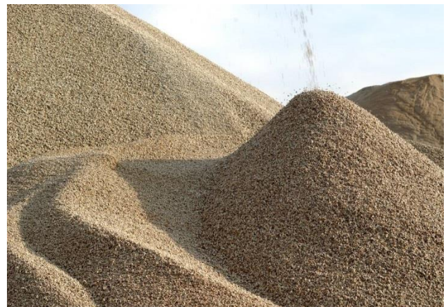
Bimskörnung auf der Halde