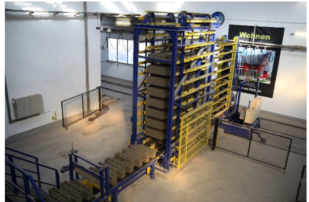
Hub- und Senkleiter