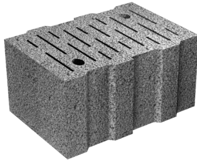
JASTOPLAN Thermstein Vbl

Fertigungsprozess auf modernen Produktionsanlagen garantieren ein hohes Maß an Gleichmäßigkeit und Qualität, für die JASTO seit Jahren steht.