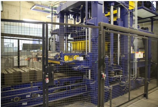
JASTO Fertigungsanlage: Steinmaschine,

Nach der Reinigung und Aufbereitung wird Bims in einem Mischer mit den Bindemitteln und Wasser gründlich zu einem erdfeuchten Beton gemischt, der in einer Steinmaschine in Formen gepresst, verdichtet und wieder entschalt wird. Die dabei entstandenen Rohlinge werden in sog. Trockenkammern ohne weitere Energiezufuhr gelagert bis der Zement soweit abgebunden ist, dass die Steine und palettiert werden können. In diesem Bereich hat JASTO in den letzten Jahren große Summen investiert, um den Fertigprozess sowohl qualitativ als auch unter energetischen Aspekten zu optimieren.