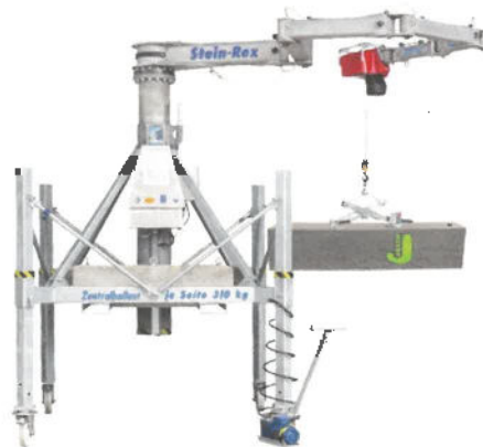
Jasto Quadro Lang Therm und Phon werden grundsätzlich mit einem Kleinkran versetzt.

Das Jasto Quadro Lang System vereint viele Vorteile. Ein effizienter Bauprozess, eine gesundheitsschonende Verarbeitung und ein deutlicher Wohnraumgewinn zählen zu den Pluspunkten.