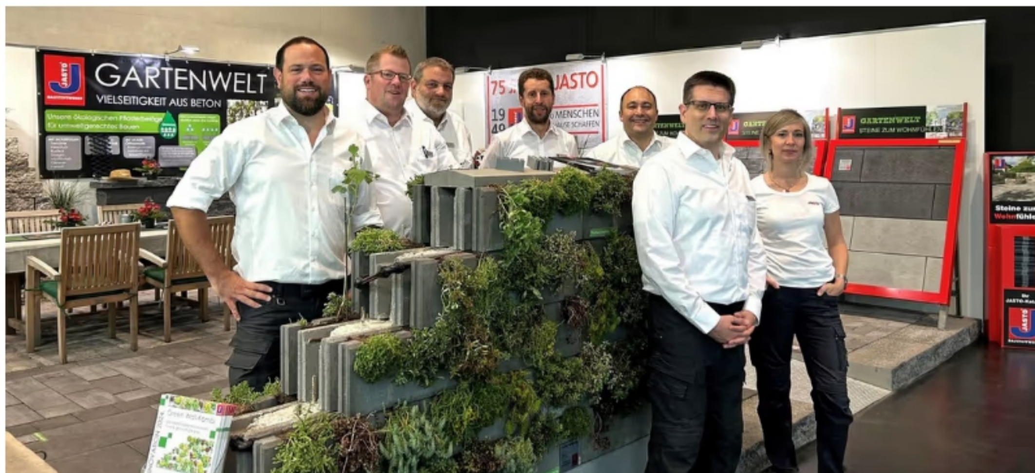
Das Jasto-Team mit der „Green Wall-Kombi“, einer begrünbaren Gartenmauer, die gerade in Städten zur Verbesserung des Klimas beitragen soll.

Dieses Mauersystem soll zur Verbesserung des Klimas in Kommunen beitragen - und als Hingucker dienen: Das Unternehmen Jasto Baustoffwerke bringt eine neue begrünbare Gartenmauer auf den Markt. Die „Green Wall-Kombi“ ist nicht nur für Privatleute, sondern auch den städtischen Raum gedacht.